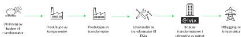
Figur: Illustrasjon av Prosjekt Kobber og ledd i verdikjeden