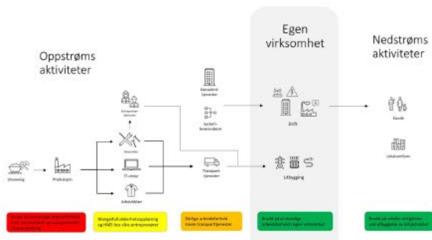
Figur: Vurdering av risiko Eidsivas verdikjeder